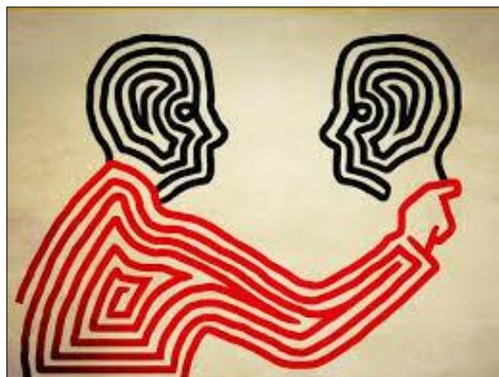
Illustraz: Beppe Giacobbe

Tecniche: Io-assertivo, Brevità e ritmo, Cambio turno (no ai monologhi), Negoziazione