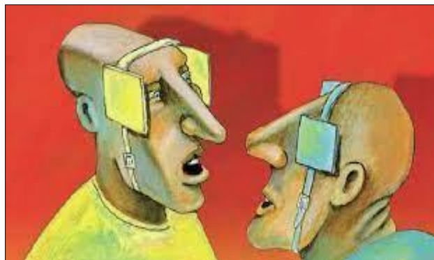
Illustrazione: Alberto Ruggeri

Tecniche: Io-assertivo, Brevità e ritmo, Cambio turno (no ai monologhi), Negoziazione