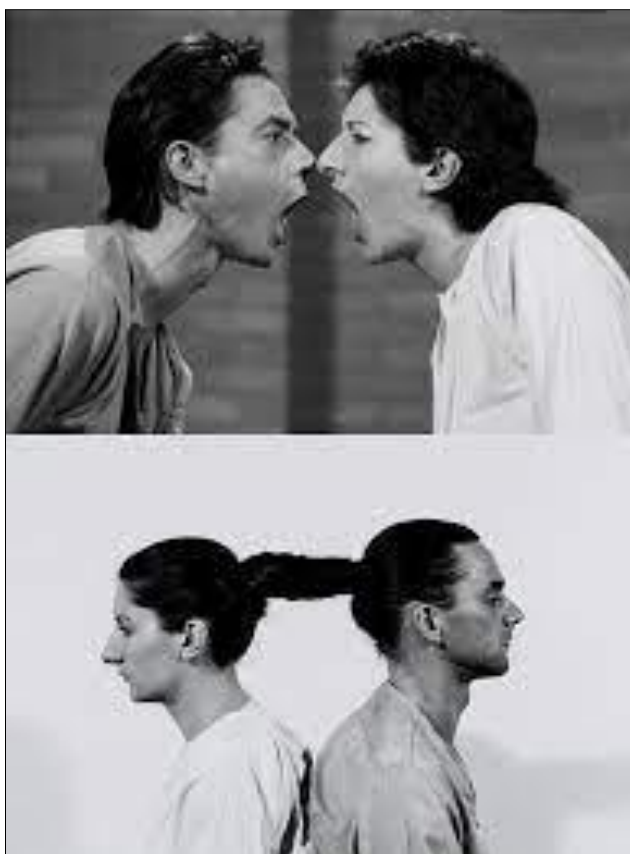
Installazione: Marina Abramovic